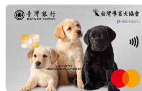
▲一卡通導盲犬認同卡